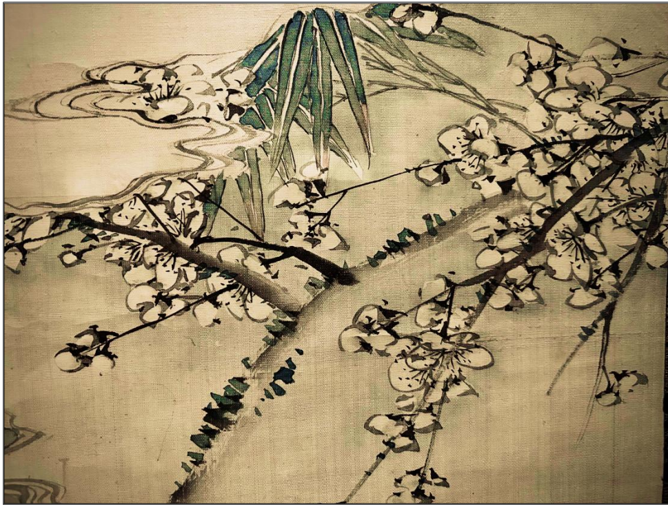
Fleurs de prunus et bambous dans la neige, Impératrice Cixi 1835-1908, Musée Baur, Femmes chinoises

Dans la culture chinoise, le lien entre le pin, le bambou et le prunus se retrouve dans leur épanouissement commun au cœur de l'hiver.